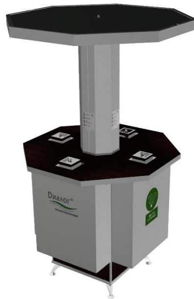
«ДВО-Альфа» Размеры, мм (Д x Ш x В) 1300 x 13000 x 2300 мм