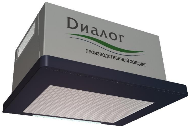
«ДВО-1» Размеры, мм (Д x Ш x В) 785 x 610 x 400 мм